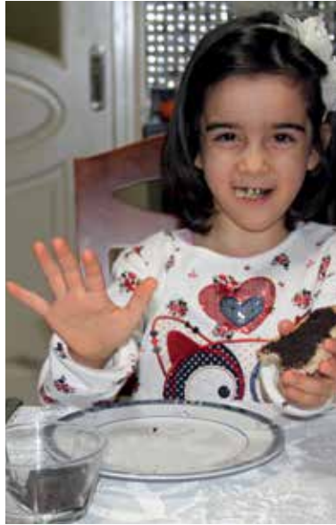
Aylin zeytin ezmesini sevmez