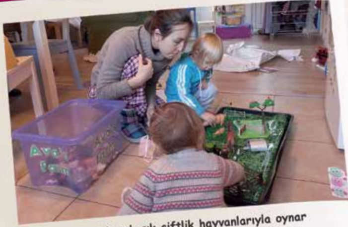
Lili ve Ava evde sık sık çiftlik hayvanlarıyla oynar