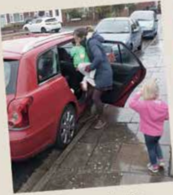
Bugün aile gerçek bir çiftliğe gidecek