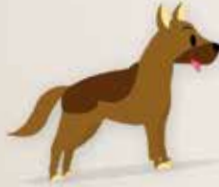
Havlayan ve hırlayan köpekler