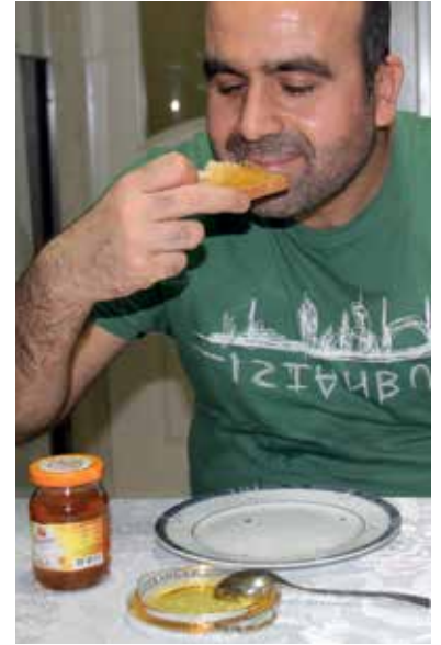
Aylin'in Babası bala bayılır

Çocuğunuzla sevdiği ve hoşlanmadığı şeyler hakkında konuşun. Onların hoşlanmadığı şeyleri başkalarının sevebileceğini fark etmesine yardım edin. Çocuğunuz olgunlaştıkça insanların farklı düşüncelere sahip olabileceğini fark edecektir.